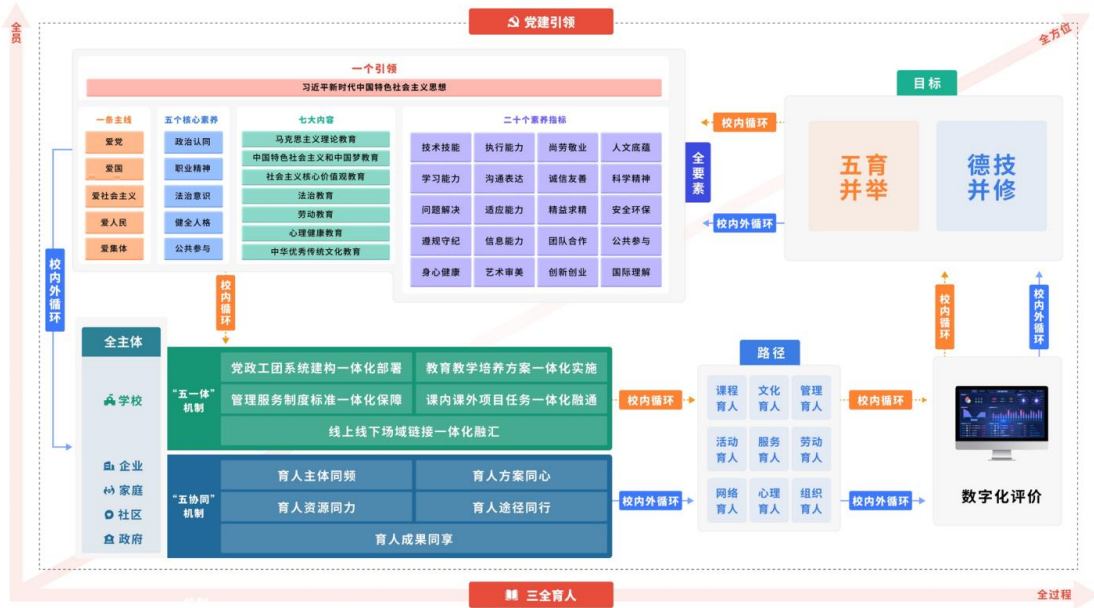
图2 中职学校党建引领下的“双循环”互促共育大思政格局